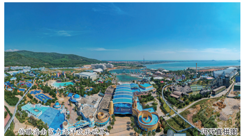
俯瞰海南富力海洋欢乐世界。