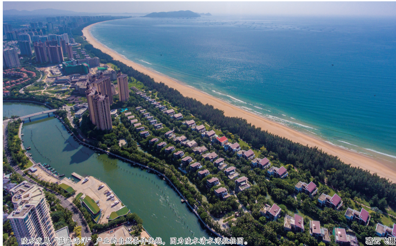
陵水发展“蓝色海洋”产业的自然条件优越，图为陵水清水湾航拍图。

陵水黎族自治县县委书记吴海峰表示，陵水充分发挥市场在资源配置中的决定性作用，打好融资“组合拳”，以“等不得、拖不得、慢不得”的紧迫感，推动项目投资及产业转型升级工作取得新进展、新成效。（琼芬）