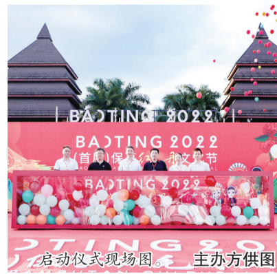
启动仪式现场图。

保亭红毛丹文化节由往年的“红毛丹采摘季”活动升级而来。启动仪式上发布了为期一个月的“果旅”文化之旅，期间将相继展开专题论坛，