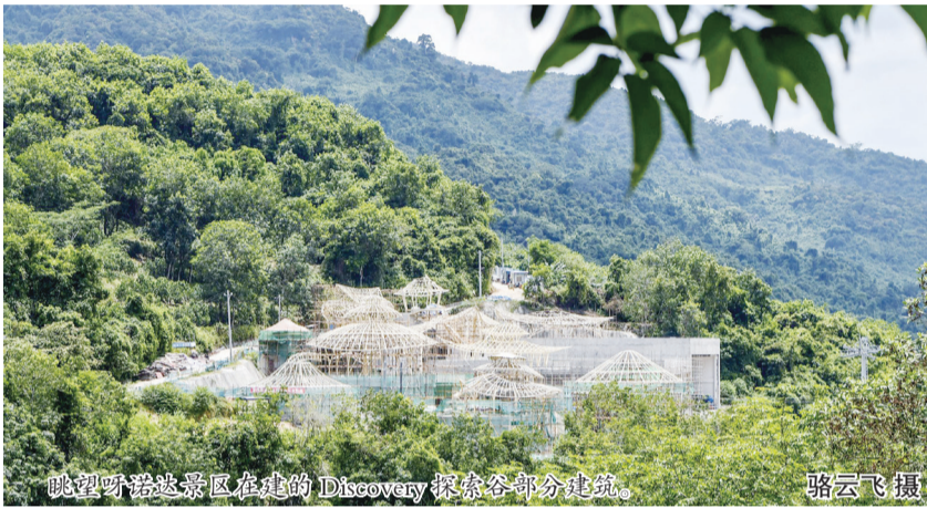
眺望呀诺达景区在建的Discovery探索谷部分建筑。