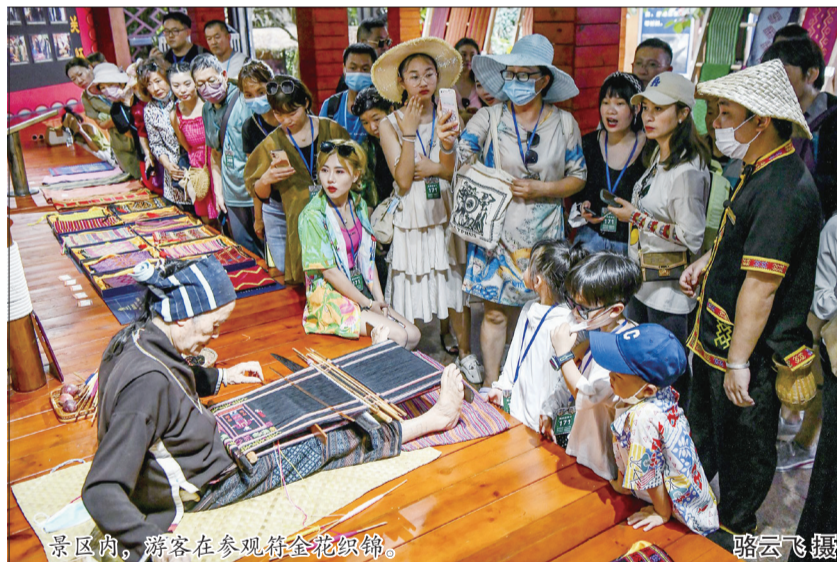
景区内，游客在参观黎锦花织锦。